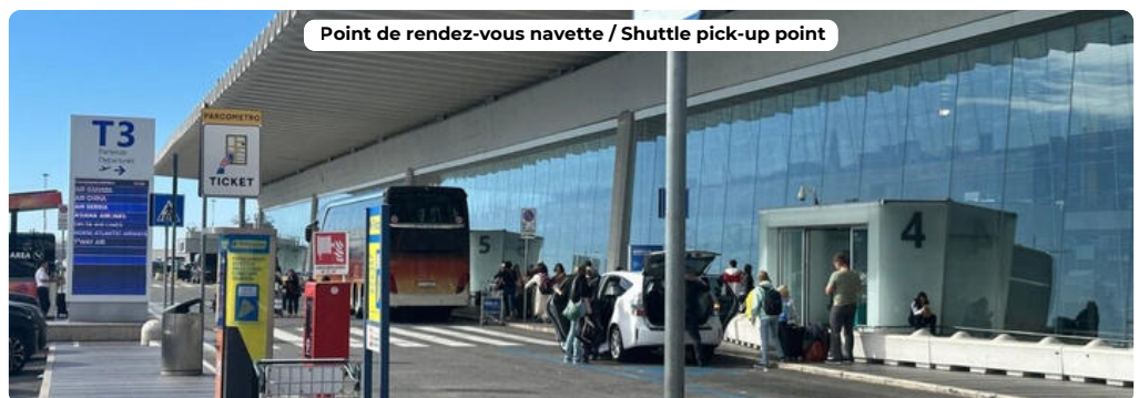
Point de rendez-vous navette / Shuttle pick-up point