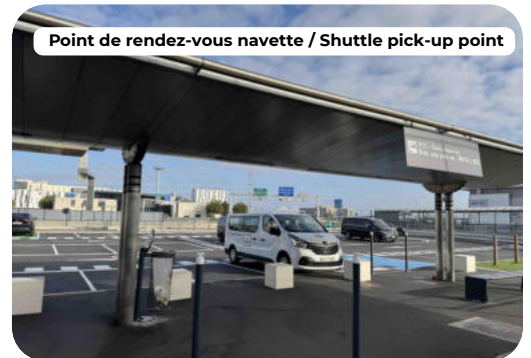
Point de rendez-vous navette / Shuttle pick-up point