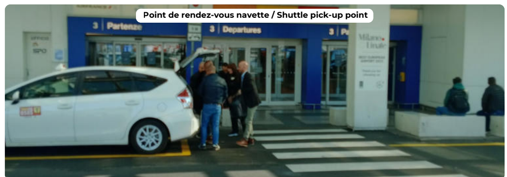
Point de rendez-vous navette / Shuttle pick-up point