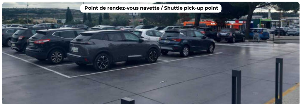
Point de rendez-vous navette / Shuttle pick-up point