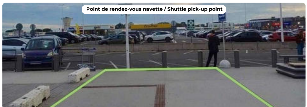
Point de rendez-vous navette / Shuttle pick-up point